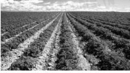
مشهد عدد 3

تبرز المشاهدة التالية ثلاثة مظاهر طبيعية تتدخل الصخور في تكوينها :