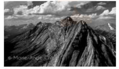
مشهد عدد 1